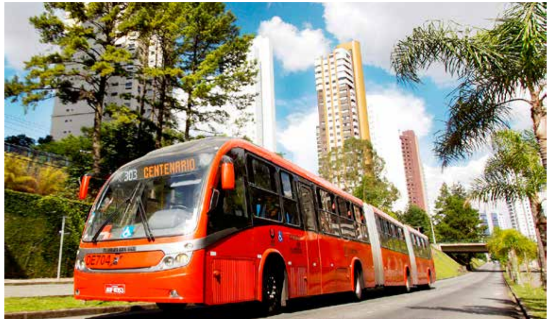
O sistema BRT (Bus Rapid Transit) de Curitiba foi adotado em diversas cidades do mundo

Sou a favor de soluções rápidas, o que chamo de “acupuntura urbana”. Acupuntura é uma ação pontual, uma agu-