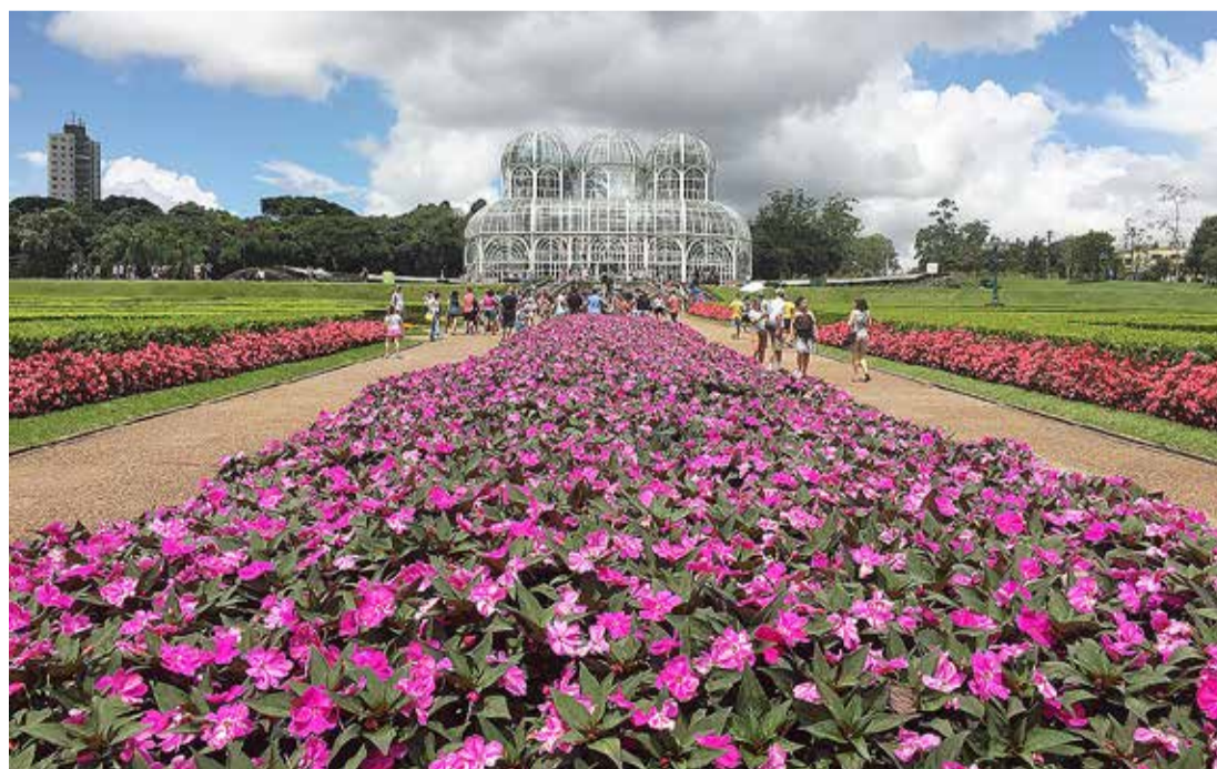
O Jardim Botânico foi um dos parques construídos na gestão Lerner em Curitiba

Lerner - O metrô é obsoleto porque é demorado, caro e